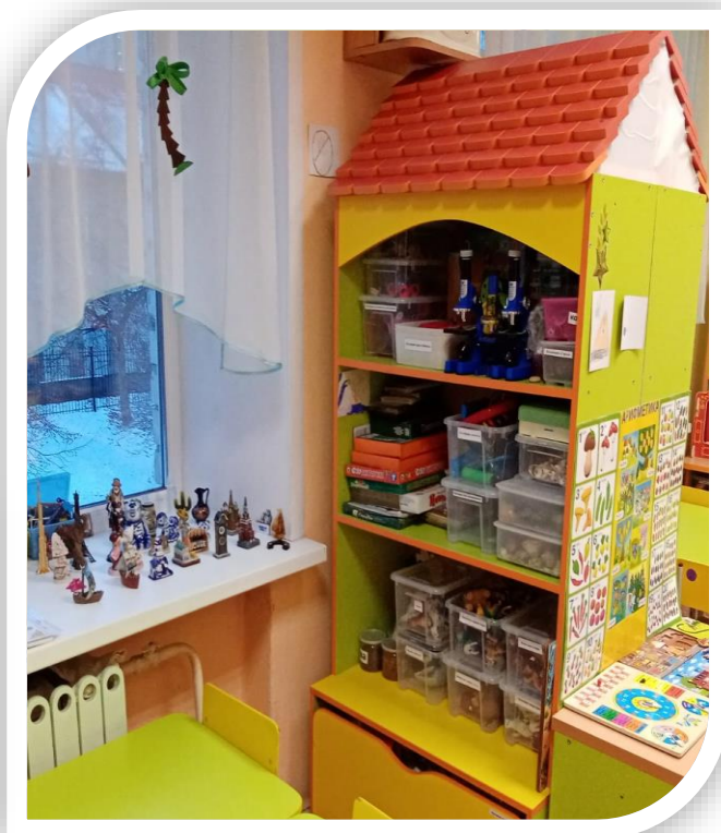
Оборудование и материалы для познавательно – исследовательской деятельности