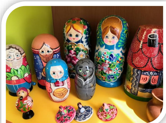
Предметы народно – прикладного творчества