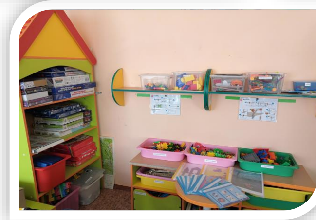
Для совместных игр