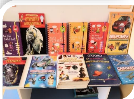
Познавательная детская литература