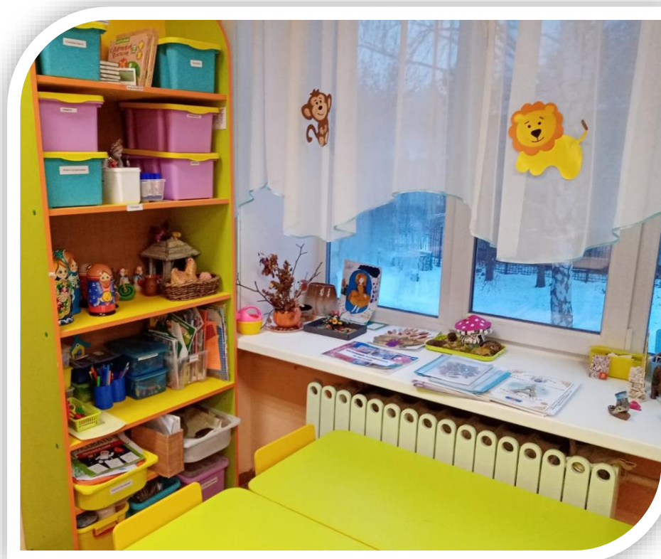
Центр детского продуктивного творчества