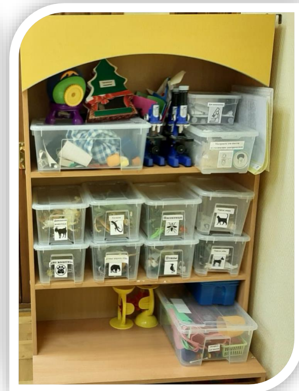
Многообразие животного и растительного мира