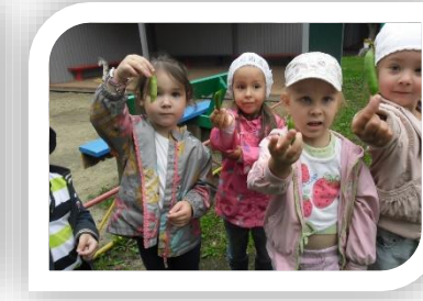
Мини-огород на территории детского сада