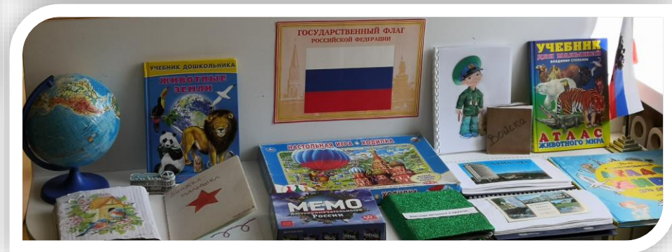
Детская литература и энциклопедии, альбомы, иллюстрации