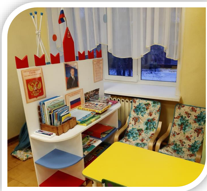
Центр «Моя Родина»