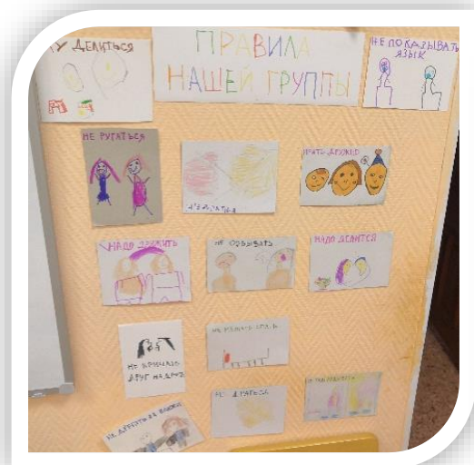
Правила наших групп