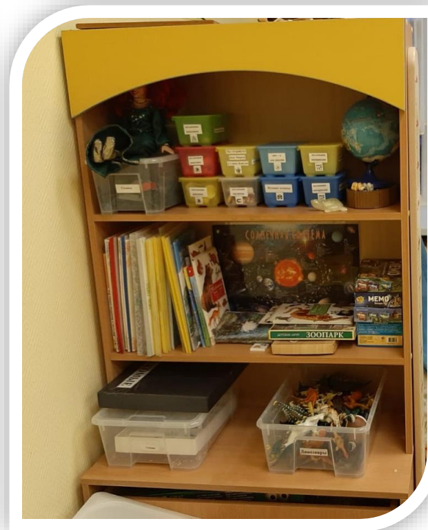
Коллекции, энциклопедии, альбомы по многообразию мира