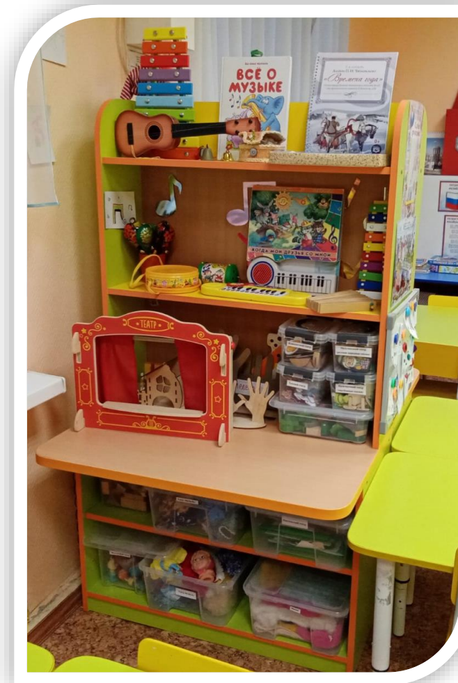
Центры музыкальный и театральный