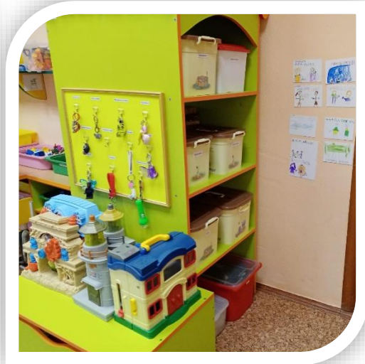
Планируем свою деятельность